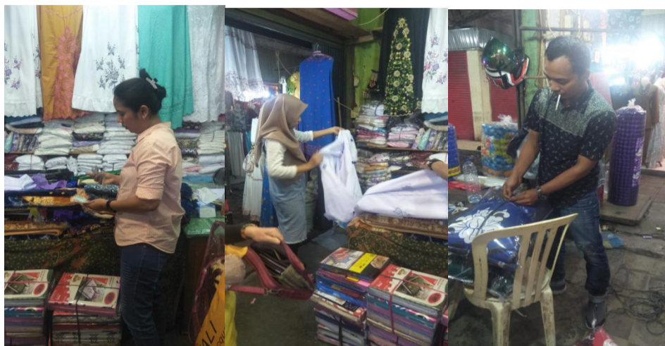
Gambar 3 Gambar Pelanggaran Penggunaan Masker Di Pasar Raya Padang

rendahnya kepercayaan masyarakat terhadap pemerintah dan rendahnya kesadaran masyarakat untuk mengikuti himbauan pemerintah untuk menerapkan protokol kesehatan. Hal ini dapat dibuktikan melalui dokumentasi berikut: