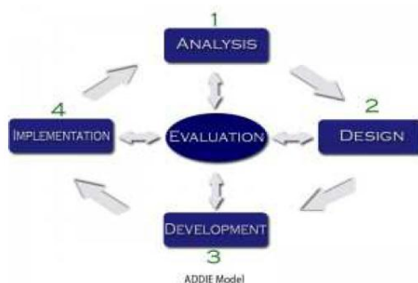
Gambar 3. Diagram alur kevin kruse ADDIE

Model pengembangan ini ditujukan untuk mengembangkan buku ajar literasi matematika pada level 1 sampai 3.