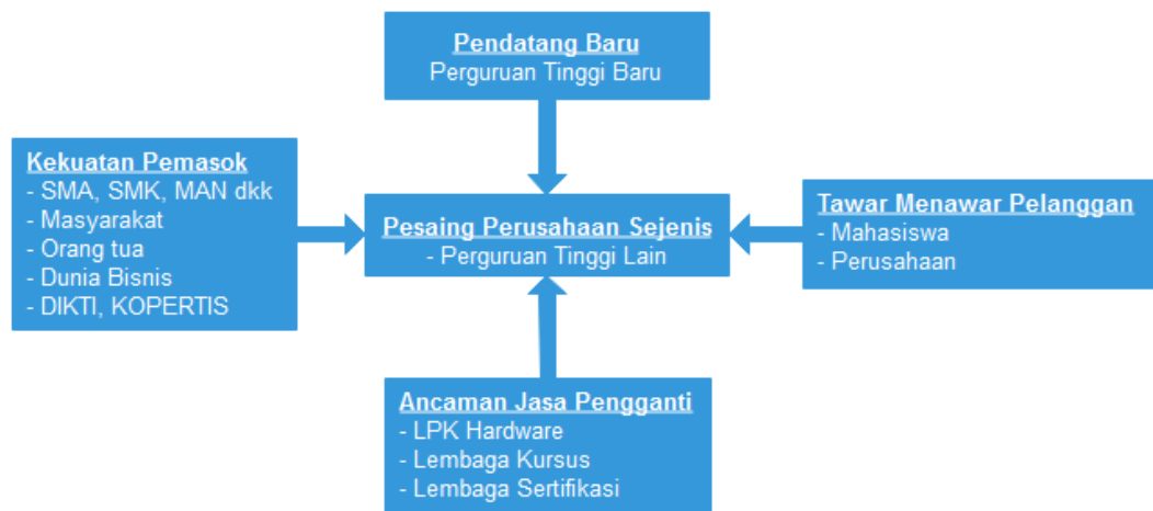
Gambar 2. Analisa Five Force Model