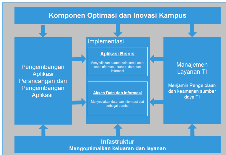
Gambar 3. Framework Tata Kelola

Strategi bisnis SI bertujuan mengumpulkan dan mengidentifikasi kebutuhan- kebutuhan strategi bisnis organisasi serta menterjemahkannya ke dalam bentuk solusi SI/TI yang dapat mendukung strategi bisnis untuk mencapai bussines objective organisasi tersebut. Untuk mencapai hal tersebut, maka di usulkan suatu framework untuk pengembangan system informasi institusi.