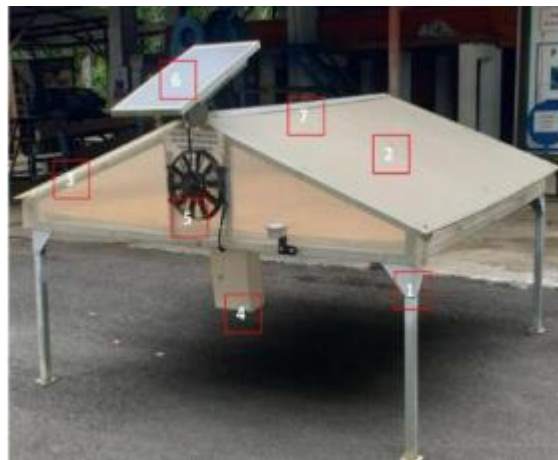
Gambar 1. Prototipe solar dryer aktif

Alat utama yang digunakan adalah prototipe solar dryer aktif.