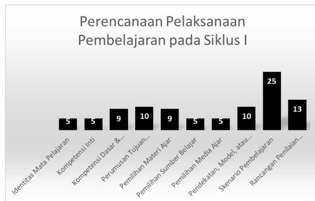
Gambar 1. Penilaian APKG I pada Perencanaan Pelaksanaan Pembelajaran Siklus I dengan skor 96

untuk tahap hasil belajar. Berdasarkan data tersebut, berikut disajikan data hasil penilaian APKG 1, APKG 2 dan hasil belajar peserta didik.