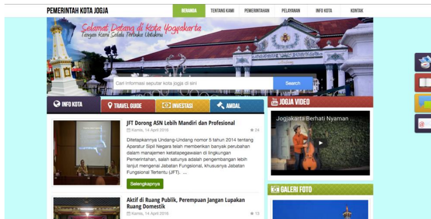
Gambar 4. Homepage situs www.jogjakota.go.id yang dikelola Humas Pemkot Yogyakarta