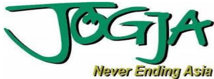
Gambar 1. Branding Kota Yogya Tahun 2001 - 2014