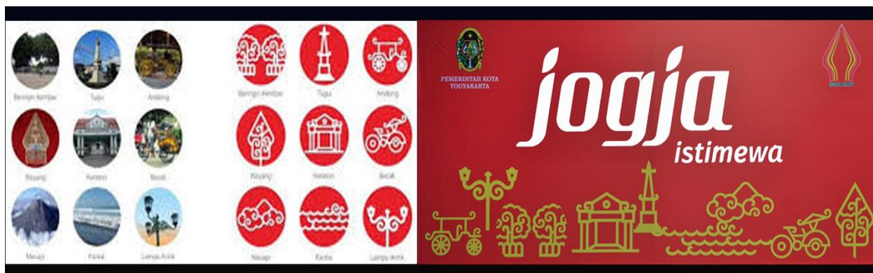
Gambar 3. Header di Website Pemkot Yogyakarta saat sosialisasi tagline “jogja istimewa”.

Gambar di atas merupakan headerwebsite yang digunakan oleh Pemerintahan Kota Yogyakarta saat mempromosikan jogja istimewa . Diletakkan di laman utama paling atas karena dianggap bisa langsung “menyapa” orang yang berkunjung ke situs resmi milik pemerintahan Yogyakarta. Menurut Mikael Mitangkasi, Amd selaku teknisi dan pengelola yang bertanggung jawab terhadap situs di Pemkot Kota, pemasangan header website hanya 1-2 bulan saja pada saat sosialisasi tagline jogja istimewa dan setelah itu diganti sesuai tema.