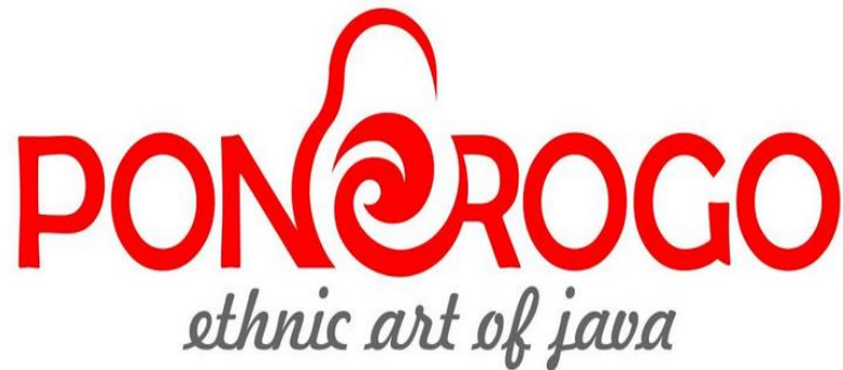
Gambar 2. Tag Line City Branding Kabupaten Ponorogo