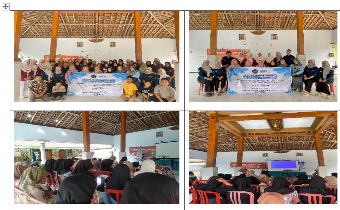
Gambar 2: Kegiatan edukasi dan penyuluhan posyandu remaja

Kegiatan ini berbentuk penyuluhan dan edukasi dengan metode SHG ( Self Help Grop ), dilanjutkan dengan pemutaran video tentang resiliensi dan manajemen stress. Program kegiatan posyandu remaja dapat dikatakan berhasil dengan telah didapatkan hasil prosentase yang meliputi proses perjalanan acara 90%, kehadiran peserta sejumlah 40 dengan prosentase 80%, kader posyandu remaja yang hadir 9 kader, mendapatkan hasil prosentase 90%. Hal ini terbukti dari antusias remaja dan kader dalam mengikuti rangkaian kegiatan (Gambar 2).