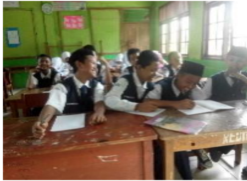
Gambar.4. Proses menulis siswa berlatih menulis narasi, setelah diterapkan metode picture to picture