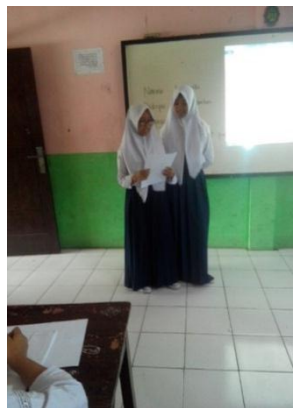
Gambar.4. Siswa membacakan tulisan narasi mereka