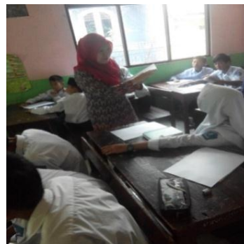
Gambar 3. Saat Latihan menulis