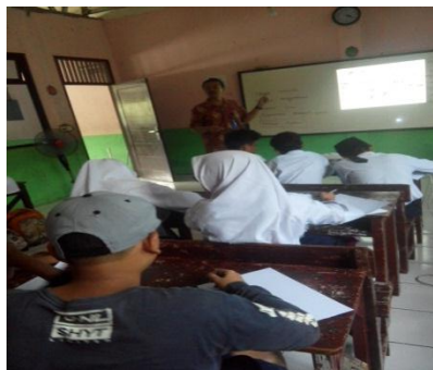
Gambar.2 Penjelasan, materi sebelum metode Picture to picture

Hal ini dikarenakan sebagian siswa cenderung agak sulit dalam mengungkapkan alur suatu kejadian. Dalam pemilihan diksi pun frasa awal dalam suatu cerita selalu dengan frasa “pada suatu hari” atau “pada siang itu” sehingga diksi yang digunakan sangat monoton atau tidak berkembang. Koherensi antar kalimat pun menjadi kendala terkadang beberapa siswa langsung meloncat kebagian inti sehingga alur dari kejadian tersebut tidak sejalan. Dalam segi keefektifan sudah cukup baik walaupun setelah dilakukan tes masih ada yang mendapatkan nilai dibawah 60. Hal ini terjadi kemungkinan bahwa siswa terbiasa berlisani secara efektif tetapi akan sulit jika bertulis secara efektif.