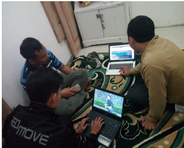
Gambar 3. Kegiatan Pendampingan

Pada kegiatan pendampingan ini terlihat mitra sudah mapu mengoperasikan dan mengelola web dengan baik. Hal ini terlihat dari langkah-langkah pengoperasian web yang digunakan oleh mitra sudah tepat selama proses pendampingan. Namun dalam kegiatan ini, masih ada beberapa kali pertanyaan yang diberikan ke tim pengabdian apabila ada yang kurang dipahami.