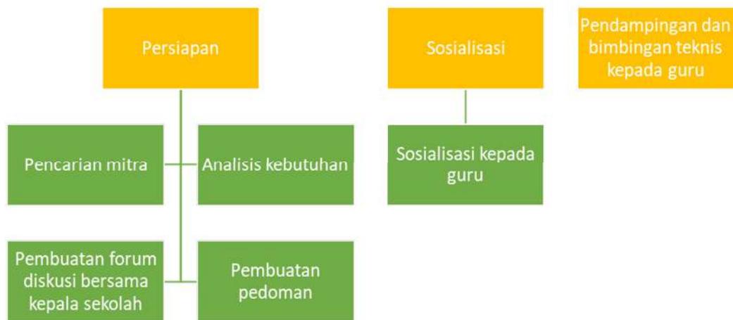
Gambar 1. Diagram Air Kegiatan Program Pengabdian

Tahapan pelaksanaan kegiatan pengabdian masyarakat ditunjukkan pada Gambar 1. Kegiatan pengabdian masyarakat ini dilakukan dengan beberapa metode yakni: survey dan diskusi dengan kepala sekolah, ceramah dan bimbingan teknis bagi guru-guru dalam mengembangkan program pembelajaran integrasi lingkungan yang disesuaikan dengan kebutuhan pembelajaran peserta didik berkebutuhan khusus, dan observasi pembelajaran pengembangan diri untuk anak berkebutuhan khusus.