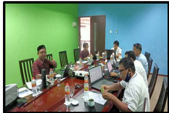
Gambar 7. Suasana saat pengerjaan analisis standar belanja