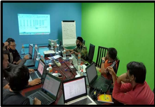
Gambar 4. Tim pengabdian sedang membimbing tata cara input data