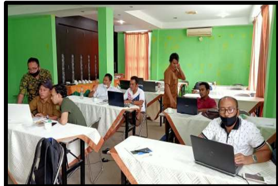
Gambar 5. Tim pengabdian sedang membimbing dan mensupervisi pengolahan data