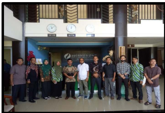
Gambar 2. Tim pengabdian melakukan foto bersama dengan peserta Bimtek di Lobi Hermes One Hotel, Subulussalam

Catatan: ASB ini berlaku untuk per ruangan yang memiliki luas minimal 25 m 2 .