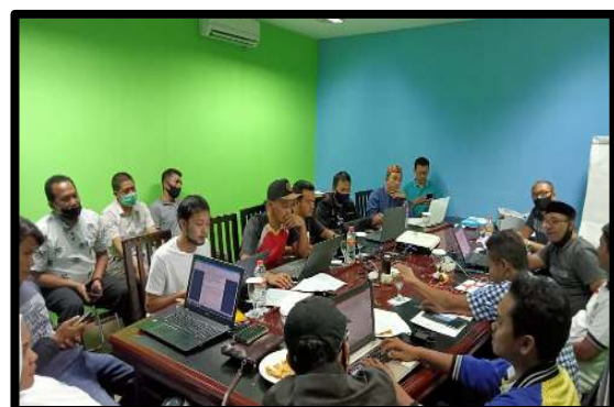
Gambar 3. Tim pengabdian sedang memberikan pemahaman tentang konsep analisis standar belanja