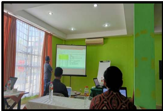
Gambar 6. Tim pengabdian sedang mengekspos hasil penyusunan analisis standar belanja