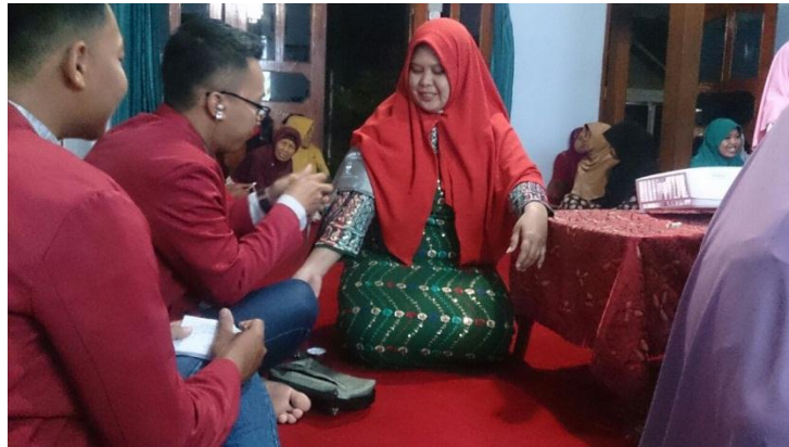
Gambar 3. Pemeriksaan tekanan darah dan pengambilan sampel darah untuk pemeriksaan laboratorium