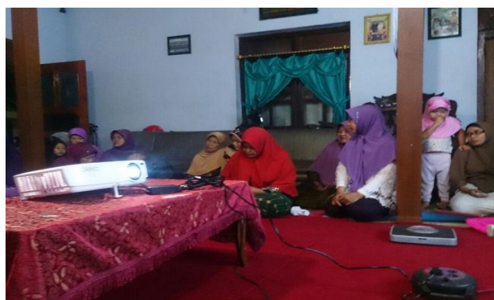
Gambar 2. Pelatihan Penghitungan GFR online