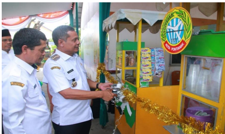
Gambar 1. Peresmian Area Kuliner di Halaman Rusunawa Harapan Jaya

Kemudian dari poin pemberdayaan untuk menciptakan ketahanan sosial dan budaya, apa yang pernah dilakukan di rusunawa harapan jaya masih jauh dari apa yang diinginkan dalam UU Rusunawa. Tidak ada satupun kegiatan baik yang berbentuk seminar, sosialisasi, ataupun workshop yang spesifik mengarah pada upaya peningkatan ketahanan sosial dan budaya. Baik itu yang diinisiasi oleh warga ataupun pengelola.