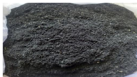
Gambar 2 Partikel Ban

Ban pada dasarnya adalah sebuah partikel yang berbentuk karet. Kebanyakan masyarakat memanfaatkannya untuk pembuatan kerajinan tangan atau bahkan ada yang dibuang sia-sia. Padahal jika diteliti dengan seksama, mereka akan menemukan kegunaan dari ban pada untuk mendukung tekhnologi saat ini. Sehingga dalam hal ini, penulis ingin memanfaatkan dan membuktikan kepada masyarakat jika ban bekas dapat dimanfaatkan sebagai bahan pembuatan komposit.