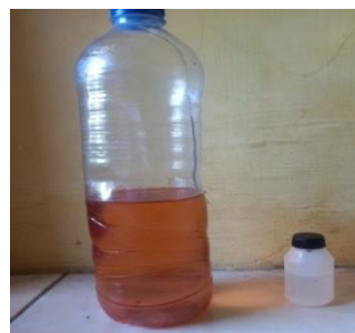
Gambar 3 Resin

Cairan epoxy digunakan untuk merekatkan dan menguatkan bahan-bahan komposit.