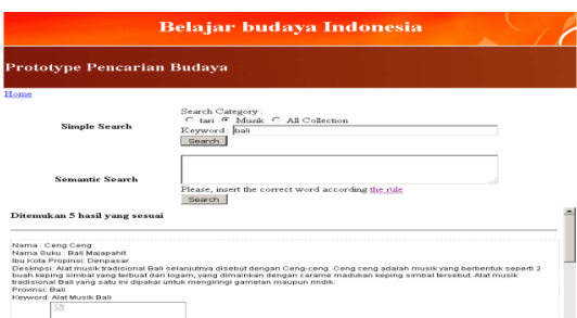
Gambar 4.4 Hasil pencarian kategori musik.

Dari gambar 4.3, gambar 4.4 Terlihat bahwa metode search mampu