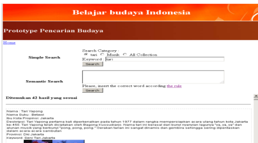
Gambar 4.3 Hasil pencarian kategori tari.

Pengujian metode pencarian pencarian sederhana bertujuan untuk mengetahui tingkat keberhasilan pencarian yang dilakukan oleh sistem dengan parameter masukkan : kategori pencarian dan keyword. Karena pencarian simple search dilakukan pada setiap value dari atribut sub-class tari,music atau keduanya sesuai dengan kategori pencarian yang dipilih user.