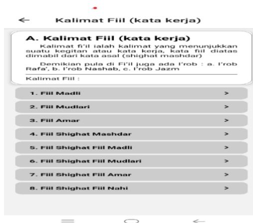
Gambar 5. Tampilan belajar Kalimat Fiil

Gambar 5 merupakan tampilan dari aplikasi tentang belajar kalimat Fiil, dalam tampilan ini ditampilkan 8 kalimat Fiil. Apabila user menklik satu dari delapan yang ditampilkan, maka akan ditampilkan pemebeljaran yang diinginkan.