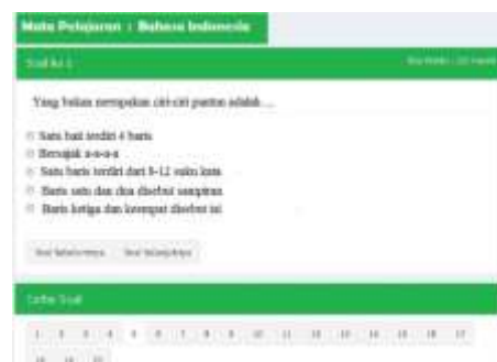
Gambar 8. Tampilan contoh soal-soal dalam aplikasi HWO

Siswa bisa memilih mata pelajaran yang ingin dikerjakan setelah menge klik tombol PR yang berada di beranda aplikasi Home Work Online (HWO). Setiap mata pelajaran diberikan tugas secara berkala oleh guru mata pelajaran sesuai dengan jadwal mata pelajaran yang ada di sekolah. Pengerjaan tugas tersebut harus dikerjakan di rumah dan diberikan waktu tertentu oleh guru. Setiap siswa harus selalu mengecek apakah guru memberikan tugas atau tidak dan siswa harus tetap terhubung dengan internet.