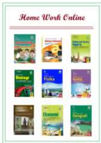
Gambar 7. Tampilan pemilihan mata pelajaran aplikasi HWO

Jendela Guru digunakan guru untuk merefleksikan terhadap hasil yang di dapatkan oleh siswa setelah mengerjakan tugas. Siswa diberikan catatan oleh guru agar siswa bisa mengetahui dimana letak kesalahannya dan mampu termotivasi untuk lebih baik lagi dalam mengerjakan tugas yang diberikan oleh guru. Selain itu, di dalam jendela guru juga terdapat konsultasi yang dilakukan oleh orang tua siswa bersama dengan guru mata pelajaran. Konsultasi tersebut dilakukan agar orang tua siswa mengetahui seberapa jauh kemampuan anaknya dalam memahami materi yang diajarkan oleh guru. Orang tua diharapkan agar terus memantau anaknya saat mengerjakan tugas. Pemantauan dilakukan agar anak dapat mengerjakan tugas tersebut dengan sungguh-sungguh.