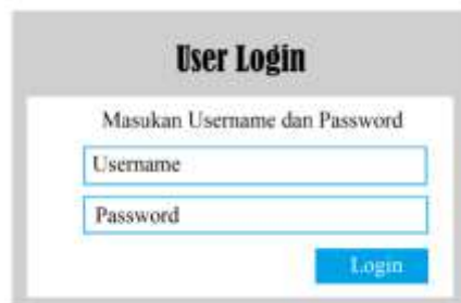
Gambar 1. Tampilan username dan password

Username digunakan untuk masuk ( login ) ke aplikasi Home Work Online (HWO) . Setiap siswa diberi username dan password yang berbeda-beda. Selain itu, orang tua siswa juga diberikan username dan password untuk mengetahui perkembangan anaknya. Antara siswa satu dengan yang lainnya pun tidak bisa mengakses akun temannya. Siswa dapat masuk ke aplikasi tersebut apabila terhubung dengan internet.