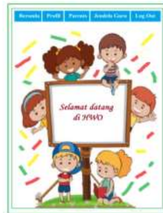
Gambar 2. Tampilan masuk ke aplikasi HWO

Username digunakan untuk masuk ( login ) ke aplikasi Home Work Online (HWO) . Setiap siswa diberi username dan password yang berbeda-beda. Selain itu, orang tua siswa juga diberikan username dan password untuk mengetahui perkembangan anaknya. Antara siswa satu dengan yang lainnya pun tidak bisa mengakses akun temannya. Siswa dapat masuk ke aplikasi tersebut apabila terhubung dengan internet.