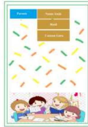
Gambar 5. Tampilan parents aplikasi HWO

kelas, dan melihat hasil yang ditampilkan dalam setiap tugas yang dikerjakan. Jika terjadi perubahan data, Jika ada perubahan data, segera menghubungi guru mata pelajaran agar segera dikonfirmasi kebenaran data yang terbaru.