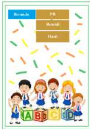
Gambar 3. Tampilan beranda dalam aplikasi HWO

Beranda dalam aplikasi Home Work Online (HWO) berisi antara lain PR, remidi, dan hasil. Jika siswa mendapatkan tugas dari guru untuk dikerjakan, maka siswa bisa memilih PR. Guru setiap saat akan mengirimkan tugas kepada siswanya. Untuk pengerjaannya siswa diberikan waktu selama 120 menit atau selama 2 jam. Siswa harus menyelesaikan tugas tersebut dan dalam pengerjaannya siswa harus mencapai kata selesai untuk mendapatkan nilai. Remidi digunakan untuk mengulang tugas apabila nilai siswa tidak mencapai kriteria ketuntasan minimal yang telah ditetapkan oleh guru. Setelah mengerjakan siswa bisa melihat langsung dari hasil yang dicapai.