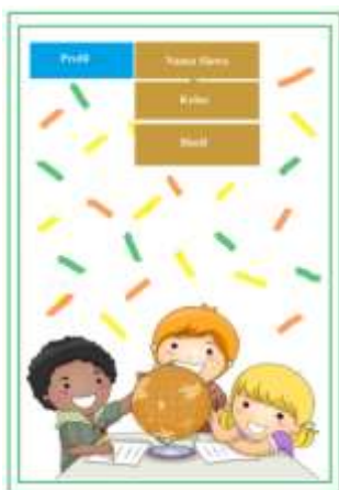
Gambar 4. Tampilan profil aplikasi HWO

Beranda dalam aplikasi Home Work Online (HWO) berisi antara lain PR, remidi, dan hasil. Jika siswa mendapatkan tugas dari guru untuk dikerjakan, maka siswa bisa memilih PR. Guru setiap saat akan mengirimkan tugas kepada siswanya. Untuk pengerjaannya siswa diberikan waktu selama 120 menit atau selama 2 jam. Siswa harus menyelesaikan tugas tersebut dan dalam pengerjaannya siswa harus mencapai kata selesai untuk mendapatkan nilai. Remidi digunakan untuk mengulang tugas apabila nilai siswa tidak mencapai kriteria ketuntasan minimal yang telah ditetapkan oleh guru. Setelah mengerjakan siswa bisa melihat langsung dari hasil yang dicapai.