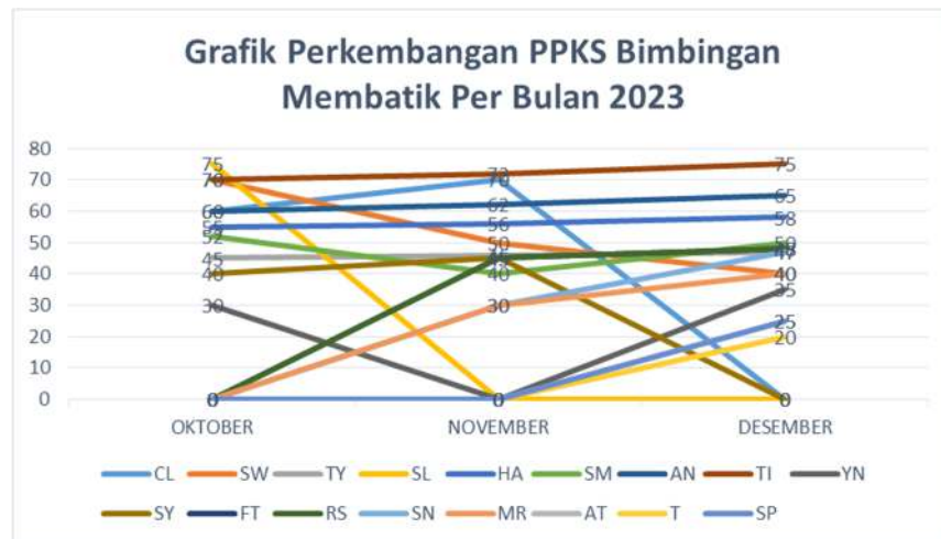
Gambar 4. Grafik perkembangan PPKS bimbingan membatik

Pengabdian ini masih terbatas pada beberapa PPKS karena yang mengikuti kegiatan hanya klien yang stabil. Perlu dilakukan pengabdian lain untuk meningkatkan kesejahteraan dan kemandirian PPKS. Harapan bimbingan membatik ini dapat diikuti lebih banyak PPKS di Balai RSBKL.