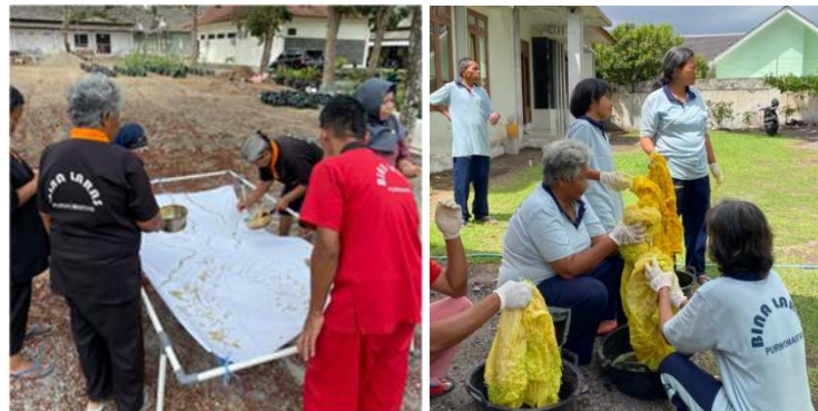
Gambar 3. Proses membuat ciprat dan jumputan.

Tahap ini peserta membuat kombinasi ciprat dengan jumputan. Pada tahap ini terdapat 8 tahapan inti yaitu : (1) membuat pola pada kain, (2) pola diciprat menggunakan malam panas, (3) membuat pola jumputan pada kain, (4) pewarnaan kain, (5) menjemur kain, (6) melepas jumputan dikain, (7) melorot malam pada kain, dan (8) menjemur kain, setelah itu kain batik sudah jadi. Dokumentasi kegiatan pada tahap ini ditunjukkan pada Gambar 3.