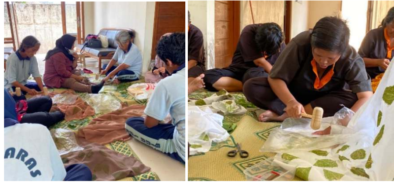
Gambar 2. Proses membuat ecoprint