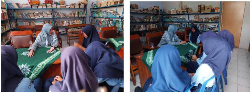
Gambar 4. Pendampingan siswa yang mengalami bullying