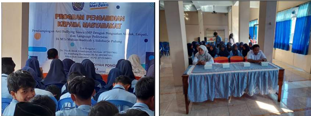
Gambar 3. Sosialisasi Anti bullying

Kegiatan ini dilaksanakan dengan cara penyampaian materi yang berbentuk power point terkait pengertian anti bullying, jenis-jenisnya, dan juga cara penanganan anti bullying. Sosialisasi program pendampingan anti perundungan dengan penguatan akhlak, empati, dan language politeness . Hal ini dimaksud untuk memberikan pemahaman terkait anti perundungan dan Solusi yang akan dilaksanakan. Dokumentasi kegiatan ditunjukkan pada Gambar 3.