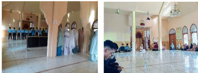
Gambar 5. Kegiatan religi dalam rangka pendampingan mitigasi anti bullying

Selain itu, empati menjadi kunci dalam memahami dan merespons pengalaman emosional teman sebaya. Melalui pendampingan ini, siswa diajarkan untuk mengembangkan kemampuan untuk melihat dari perspektif orang lain, mempromosikan sikap peduli dan mendukung dalam komunitas sekolah. Kesantunan berbahasa juga merupakan aspek penting dalam mengurangi insiden bullying. Melalui pendampingan ini, siswa diajarkan untuk berkomunikasi secara efektif dan hormat, baik dalam percakapan langsung maupun melalui media sosial. Hal ini mencakup penggunaan bahasa yang sopan, menghargai perbedaan, dan mengekspresikan pendapat dengan cara yang membangun. Dengan mengintegrasikan penguatan akhlak, empati, dan kesantunan berbahasa dalam pendampingan anti-bullying, diharapkan dapat menciptakan lingkungan sekolah yang aman, inklusif, dan mendukung perkembangan penuh potensi setiap siswa. Langkah-langkah ini tidak hanya bertujuan untuk mengurangi insiden bullying, tetapi juga untuk membentuk generasi muda yang lebih peduli, bertanggung jawab, dan memperhatikan satu sama lain dalam masyarakat yang semakin kompleks ini.