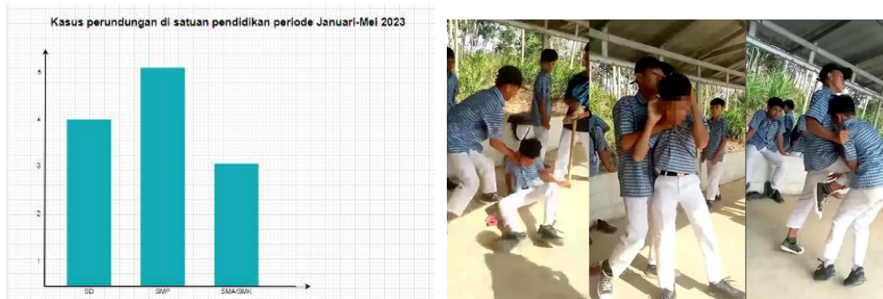
Gambar 1. Kasus Perundungan tahun 2023