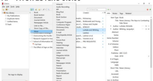
Fitur-fitur pada Zotero 5.0.66

Zotero dapat menyimpan berbagai jenis bibliografi seperti buku, koran, karya seni, email, program komputer, surat, manuskrip, majalah, presentasi, thesis, dll. Namun, fitur yang paling efisien adalah add on yang memudahkan penggunanya untuk menyimpan halaman website sebagai bentuk referensi dan akan tersimpan dalam library.