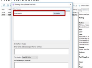
Menu Group Sharing pada EndNote X9